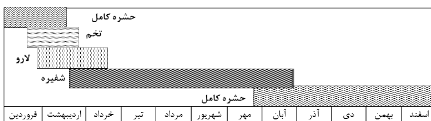
شکل ۲- چرخه زندگی مگس مینوز خار پنبه، P. terebrans در شرایط طبیعی.