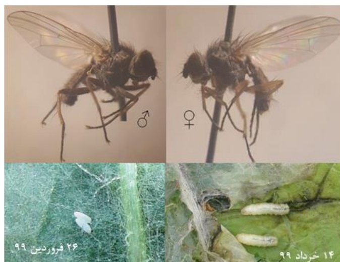
شکل ۳- حشرات کامل (نر و ماده)، تخم و لاروهای مگس P. terebrans Fig. 3. Adults (male & female), eggs and larvae of P. terebrans

لاروهای جوان حدود یک میلی‌متر بوده و بلافاصله بعد از خارج شدن از تخم، با سوراخ کردن اپیدرم برگ وارد پارانشیم برگ شده و به طرف رگبرگ‌های فرعی و در ادامه رشد به طرف رگبرگ‌های اصلی کشیده می‌شوند. لاروها ضمن رشد و تغذیه از پارانشیم برگ‌ها از فضای خالی و لوله مانند موجود در رگبرگ اصلی O. leptolepis و O. acanthium برای جابجایی در بافت‌های درونی برگ استفاده می‌کنند. لاروها کرمی شکل بوده و نمای کلی مخروطی دارند. رنگ آنها سفید مات بوده و به علت کم رنگ بودن بافت‌های بدن، محتویات درونی دستگاه گوارش و غذای خورده شده به وضوح قابل رویت است (شکل ۳). طول لاروهای کاملاً رشد کرده ۷/۲ \pm ۰/۴ میلی‌متر (تعداد ۲۰ عدد) محاسبه شد. مرحله لاروی این مگس دارای سه سن می‌باشد که ابعاد طولی و عرضی و وزن مراحل سه گانه لاروی آن در جدول ۱ ارائه شده است. در شرایط طبیعی کامل شدن دوره‌ی رشد و نمو لاروی ۱۷/۳ \pm ۴/۵ روز (حداقل ۱۸ و حداکثر ۲۵ روز) طول می‌کشد.