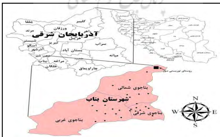
شکل ۱- موقعیت جغرافیایی روستای صور

کیم ۲ (۲۰۰۵) در پژوهشی نقش گردشگری به عنوان محرکی برای از بین بردن مشکلات اقتصادی در جامعه روستایی کره را مورد بررسی قرار داده و به این نتیجه می‌رسد که دولت و بازار نقش مهمی در مشارکت برنامه‌های توسعه گردشگری در روستاهای این کشور دارند. آلمیدا زامبرانو ۳ در سال ۲۰۱۰ در مقاله «اثرات محیطی و اجتماعی اکوتوریسم در جزایر کاستاریکا» با در نظر گرفتن نقش اکوتوریسم در حفظ محیط طبیعی و رضایت جامعه محلی به اثرات توسعه آن در جزایر یاد شده پرداختند. ژانگ ۴ (۲۰۱۲) در پژوهشی با عنوان «استراتژی‌های توسعه گردشگری روستایی» با استفاده از مدل SWOT به اتخاذ استراتژی‌های توسعه گردشگری روستای سوژو ۵ در کشور چین پرداخته است. در این پژوهش با تأکید بر ترکیب منابع داخلی و خارجی و مزایا و نقطه ضعف‌های روستای سوژو، استراتژی توسعه پایدار گردشگری این روستا تدوین نشده است. راست‌قلم (۱۳۸۸) در مقاله‌ای با عنوان «بررسی مزیت‌ها و محدودیت‌های توسعه کانون‌های گردشگری با استفاده از تحلیل سوات (مطالعه موردی: کانون‌های گردشگری شهرستان شهرکرد)»، به این نتیجه