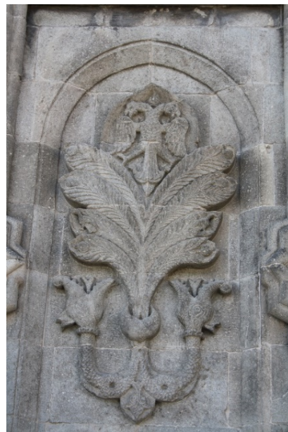
تصویر ۶- نقش مایه درخت زندگی در سردر مدرسه چفته مناره، ارزروم.

سماچتین بر این باور است که ریشه نقش مایه درخت زندگی، در مفهوم جهان و برکت، در هنر این دوره به تاثیر باورهای آسیای میانه بازمی‌گردد (Çetin, 2012: 11,14).