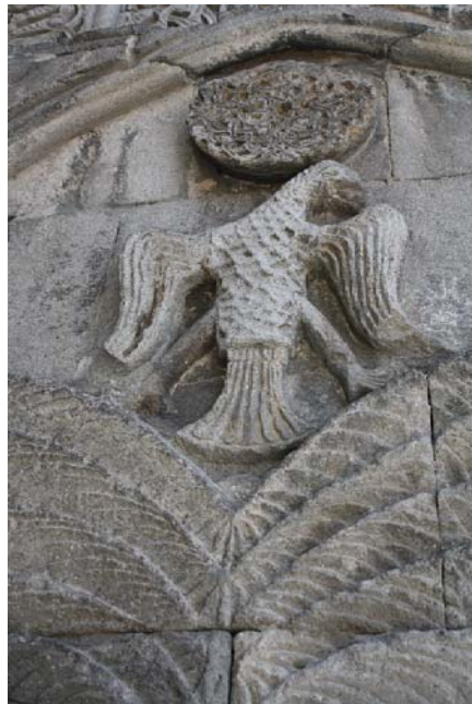
تصویر ۷ - نقش عقاب دوسر (تغییر شکل یافته) بر بالای درخت زندگی، مدرسه یاقوتیه (نگارنده).

شمن نیز هست. چون که شمن به واسطه درختی که زمین و آسمان را بهم مرتبط می‌سازد، به آسمان راه یافته و به اوج می‌رسد. در کنار این مفاهیم، نماد روشنایی و خورشید نیز تلقی می‌گردد (Ibid).