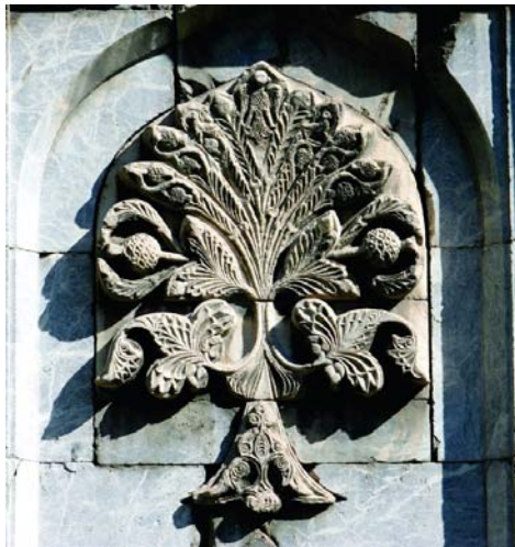
تصویر ۵- نقش درخت زندگی بر سردر ورودی گوک مدرسه شهر سیواس، ۱۲۷۱ م. (URL).

این سردر مزین به نقوشی است که از بطن تاریخ فرهنگی، اجتماعی و دینی مردمان این منطقه سرچشمه می‌گیرد. عمده تزیینات به کاررفته در این بنا، حجاری روی سنگ است که بر روی ستون‌ها، سردر وردی اتاق‌های درس و دیگر بخش‌ها با تنوع بسیار، کار شده است. اما اصلی‌ترین تزیینات بنا در سردر ورودی بنا به چشم می‌خورد. در دو سمت سردر ورودی مدرسه، قاب‌هایی در دیوار به صورت قوسی شکل تعبیه شده است. در داخل این قاب‌ها، نقش برجسته‌ای وجود دارد که درخت زندگی با فرم برگ‌های درخت نخل از داخل یک گلدان سربرآورده است (تصویر ۴). تعداد شاخه‌های این درخت در مجموع شانزده عدد می‌باشد. بر روی شاخه‌ها میوه‌هایی دیده می‌شود. در دو طرف درخت زندگی، تصویر دو شیر و در بالای آن، نقش مایه عقاب دوسر وجود دارد. «این نقش مایه با گذشت زمان و حوادث طبیعی به صورت عقاب تک سر درآمده است» (Ağaç, 2015: 10).