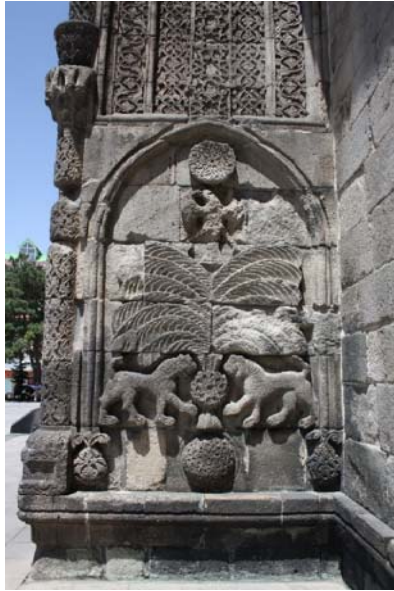
تصویر ۴- نقش مایه درخت زندگی در سردر مدرسه چیفته مناره، ارزروم (نگارنده).