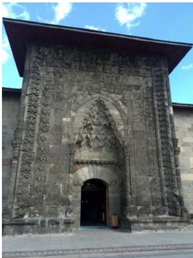
تصویر ۲- سردر مدرسه یاقوتیه.