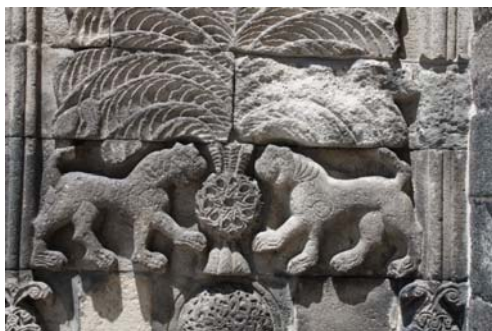
تصویر ۸ - نقش‌مایه شیر در اطراف درخت زندگی، مدرسه یاقوتیه.

به اعتقاد کاترینا اتنو دورن ۱۵ شیر در نقش محافظ میوه‌های درخت مقدس از تداوم یک سنت قدیمی خبر می‌دهد. در هنر هند، بین‌النهرین باستان و هنر ایران نیز شیر به عنوان نماد خورشید و محافظ دروازه آسمان به‌کار رفته است. در بناهای یادبود و دروازه ورودی شهرهای سلاجقه نیز نقش شیر با کاربرد محافظ خبر از یک سنت باستانی دارد. مجسمه شیر در شهر و بناهای قرون وسطی با نقش محافظ در برابر نیروهای بد و پلیدی که از بیرون وارد می‌شوند، روی درهای ورودی و جبهه خارجی بناها کار شده است (Peker, 1996: 30-3).