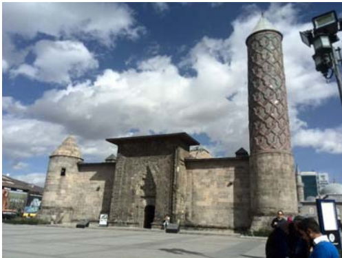
تصویر ۱- نمای کلی مدرسه یاقوتیه و سردر ورودی (نگارنده).

170-167: 2006). تزیینات به کار رفته در سردر ورودی این مدرسه، به شکل حجاری بر روی سنگ، چشم نواز و خیره کننده است. نمونه همین تزیینات را در دیگر سردرهای دوره سلجوقی و ایلخانی می بینیم. این بنا یک مدرسه چهار ایوانی با حیاط مربع مستطیلی است و صحن آن دارای طاق مرکزی مقرنس کاری با روزن گردی است. سه ایوان و چهارده حجره به این صحن باز می شود. در جبهه غربی مدرسه، سردر قرار دارد که از بدنه بنا، بیرون زده است. در محور جبهه شرقی، قاعده مکعبی شکلی با مناره استوانه‌ای خودنمایی می کند. مناره‌ها در اطراف سردر ورودی واقع نشده؛ بلکه به گوشه‌های بنا رانده شده‌اند. احتمال می رود یکی از مناره‌های موجود در سمت چپ بنا یا از بین رفته و یا اصلاً ساخته نشده است (تصاویر ۱ و ۲).