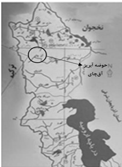
شکل (۱): موقعیت حوضه آبریز آق‌چای در استان آذربایجان غربی

مهمترین زهکش این حوضه آبریز بوده و سد مخزنی آق‌چای در خروجی آن قرار گرفته‌است. این رودخانه یک رودخانه دائمی و از سرشاخه‌های رودخانه قطورچای می‌باشد. این منطقه از نظر تقسیم‌بندی هیدرولوژیکی از زیرحوضه‌های حوضه آبریز اصلی دریای خزر می‌باشد (پیرنیا، ۱۳۹۲). شکل (۱) موقعیت حوضه آبریز آق‌چای در استان آذربایجان غربی را نشان می‌دهد.