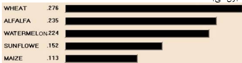
شکل ۳- شمای از تعیین الویت کشت با نرم افزار Expert Choice ۹

نهایتاً بر اساس فرآیند تحلیل سلسله مراتبی، الویت کشت به ترتیب با گندم، یونجه، هندوانه، آفتابگردان و ذرت (شکل ۳) می باشد. شایان ذکر است که کشت گندم، یونجه و هندوانه با توجه به شاخص درآمد محاسبه شده و ویژگی های خاکی از لحاظ اقتصادی مقرون به صرفه بوده ولی سایر تیپ های بهره وری در این منطقه توصیه نمی گردد. نرخ ناسازگاری کلی برای این ارزیابی ۰/۱ برآورد گردید و قابل قبول می باشد.